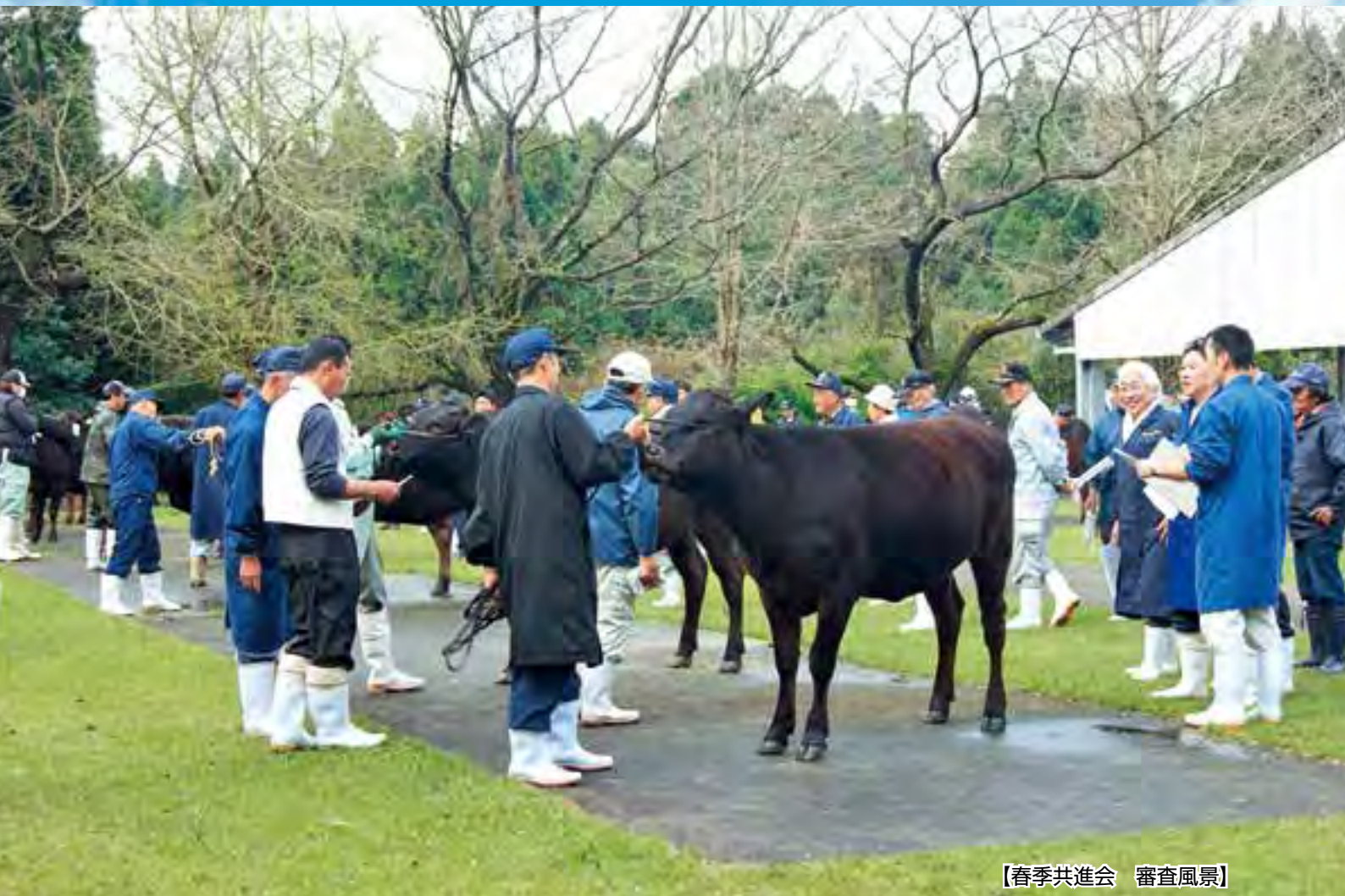
【春季共進会 審査風景】

稲作部会第27回通常総会、でん紛用さつまいも部会総会、尚志館へ寄贈…………… P2 ゴーヤ部会出荷会議、総決起大会、全国農産物鑑定会、安全祈願祭… P3 茶栽培部会第40回通常総会、一番茶生産対策会、平成25年度入組式…………… P4 春季畜産共進会、曾於地区春季畜産共進会、春夏メロン出荷会議… P5 平成25年産春かぼちゃ出荷協議会、福祉センターだより………… P6 女性部からこんにちわ…………… P7