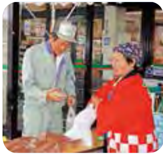
おいしいふくれですよ♡

「これから息子に宅配で送る」と、全種類買われたお客様や、お彼岸用や、おみやげ用に購入する方も多く、たくさん用意したふくれはあっという間に完売。本年度も、Aコープあおぞら店と共に地域に密着した活動をしていきたいと思えます。