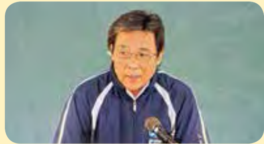
福田代表理事挨拶