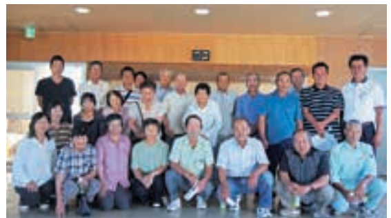
ゴーヤー部会の皆さん

その後、各市場の情勢報告があり、平成24年度生産販売実績について協議されました。