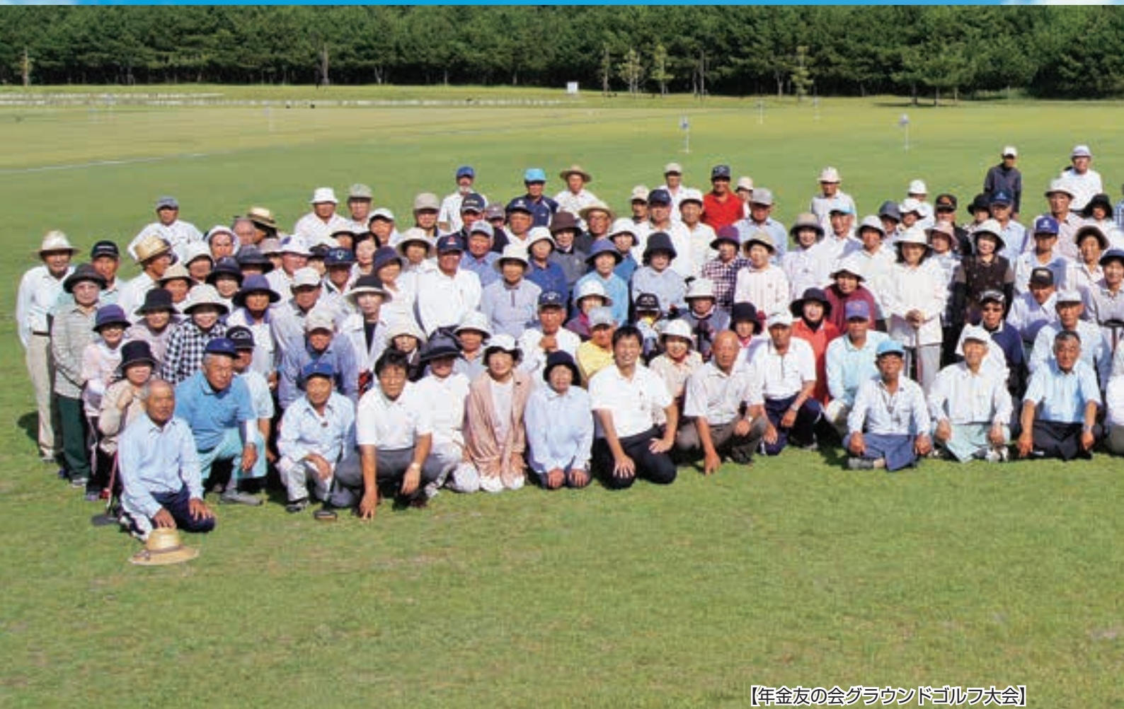
【年金友の会グラウンドゴルフ大会】

年金友の会総会、志布志フェスタ、普通米仮渡価格… P2 さつまいも出荷会議、ゴーヤー実績検討会、秋季畜産 共進会、力士訪問…………… P3 年金友の会GG、年金受給者ゴルフコンペ、年金友の 会企画旅行、選果場改修工事…………… P4 JADDOカード稼動イベント、平成25年度運営モニ ター会、農政報告…………… P5 監督職合宿、街頭パレード、福祉センターだより、文 藝同好会…………… P6