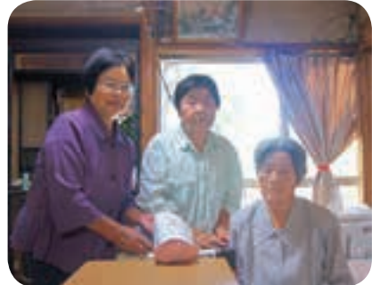
～私たちが「愛」をお届けします～