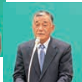
内村経営管理委員会 会長挨拶風景