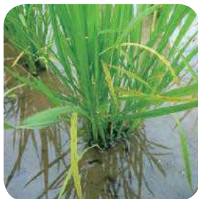
有害ガスによる生育状況 【下葉が黄色化、分けつ低下】