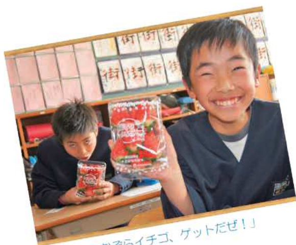
「あおぞらイチゴ、ゲットだぜ！」

J A あおぞらでは、食農教育の一環として毎年町内の7小学校の6年生を対象に町内の特産品を配布し、食と農について理解を深める活動をしています。