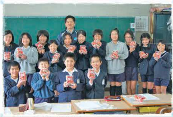
伊崎田小学校の皆さん