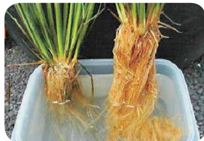
◎発根の比較 左：有害ガス被害株 右：健全株