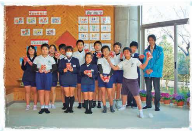
蓬原小学校の皆さん