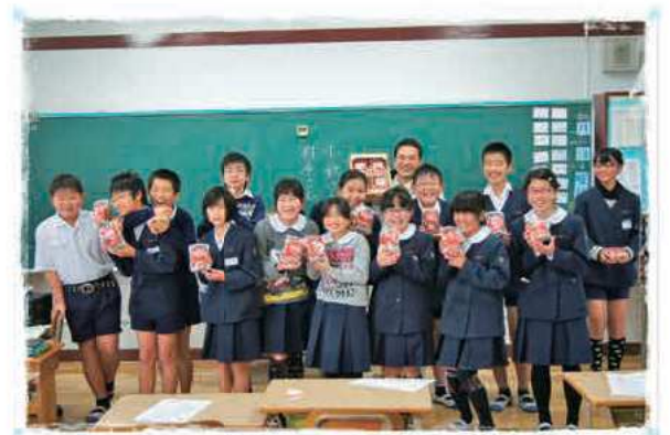
有明小学校の皆さん