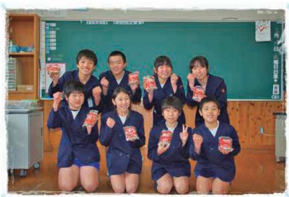
山重小学校の皆さん