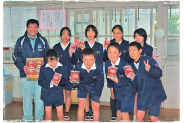
原田小学校の皆さん