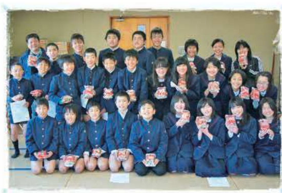
通山小学校の皆さん