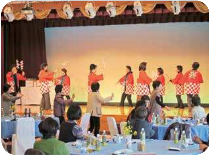
皆で踊るの、楽しい～