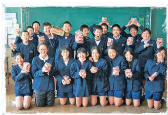
野神小学校の皆さん