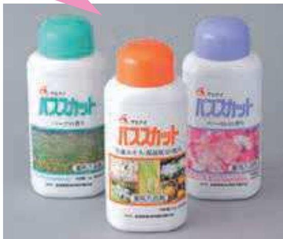
<ハーブ> 1,300円(税抜) <生薬> 1,300円(税抜) <フローラル> 1,000円(税抜)