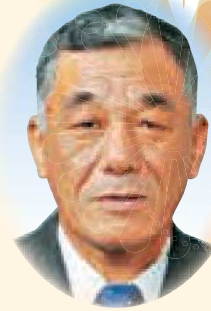
経営管理委員会会長