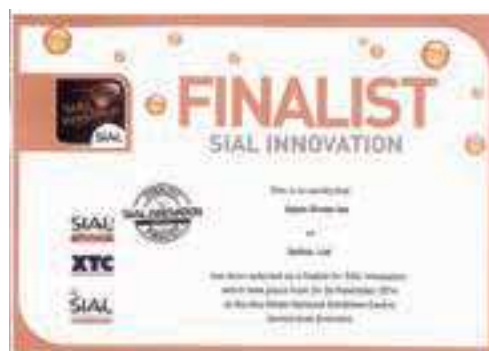
イノベーション賞証明書

※ハラールとは…イスラム教の戒律に従っているものや活動のこと。そのものの生産過程がイスラム法上の合法であることを示すのがハラール認証です。