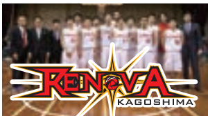
レノヴァ鹿児島（プロバスケットチーム）