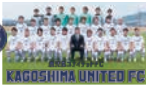
鹿児島ユナイテッドFC（プロサッカーチーム）

今後は、JAグループが主催する食農教育活動や清掃活動をはじめ、「ちびっこサッカー大会」や農業祭に選手を招くなど、タイアップしたイベント企画も積極的に行っていきます。各チームの試合日程については、HPに掲載されていますが、鹿児島ユナイテッドFCについてはJ3参入に向け、年間3万人以上の観客動員が必要です。