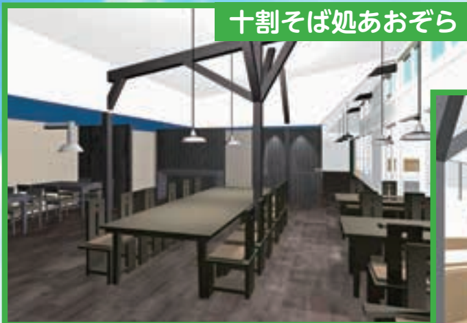
十割そば処あおぞら

▲地元食材を中心に使用し、若い方からお年寄りまでどなたでも気軽にご利用いただけるスペースです。