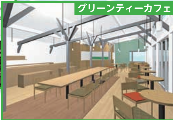
グリーンティカフェ

▲有明茶はもちろん、珍しいお茶が豊富にあります。 地域食材を使ったスイーツを準備してお待ち致しております。 子どもさんも「あおぞらのお茶」を知るチャンスです！