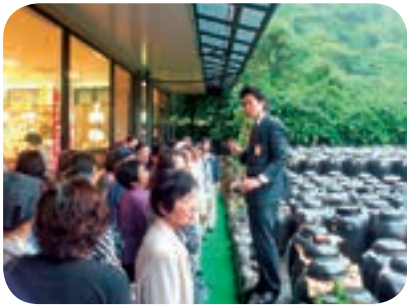
壺畑を前に説明を受ける参加者