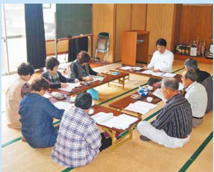
猜ヶ宇都集落座談会の様子

五月十一日から十三日にかけて役職員が各集落に赴き、第十五回通常総代会資料の事前説明座談会を開催しました。組合員の皆さまからのご意見・ご要望を事業運営に反映させる貴重な声として、内部で十分協議してより良い農協運営に努めてまいります。