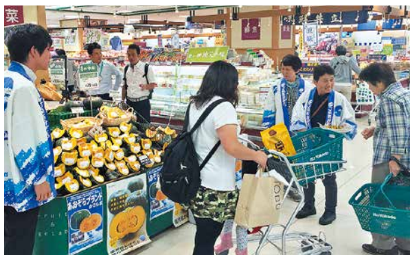
かぼちゃをPRする生産者

6月3日、かぼちゃ部会は千葉県のイトーヨーカ堂でかぼちゃ販売を行いました。試食を用意し、買い物客に「ホットプレートで蒸すときに塩をふりかけるだけで、かぼちゃ本来の味が出るのでおすすめの食べ方ですよ」などとPRをしました。生産者の皆さんは「最初は緊張したけれど販売していると楽しくなった」と話しました。