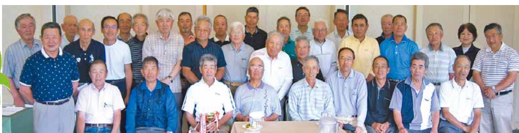
プレーを楽しんだ 参加者のみなさん