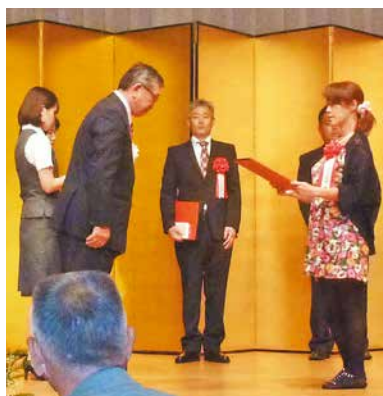
授賞式の(有)カーセンター大隅さん