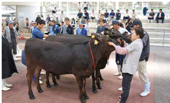
4部(父系群)の比較審査の様子

5月18日、曾於中家畜市場で平成28年度曾於地区春季畜産共進会が開催され、有明町から出品した12頭のうち6頭が入賞する快挙でした。