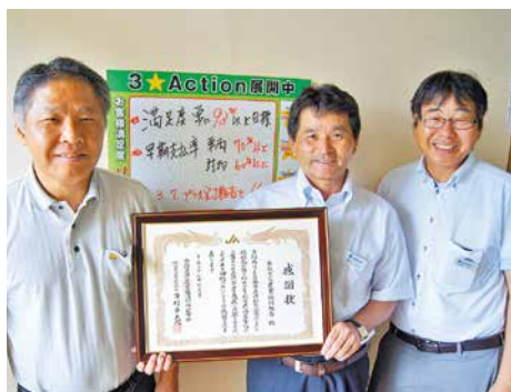
自動車共済損害事故対応担当者

J Aは、平成 27 年度 J A 自動車共済利用者満足度調査（契約件数 5,000 件以下）で全国第 14 位となり、鹿児島県で唯一、全国共済農業協同組合連合会より感謝状を受けました。今後も、お客様の気持ちに寄り添い、事故処理の迅速かつ丁寧な対応を心がけます。