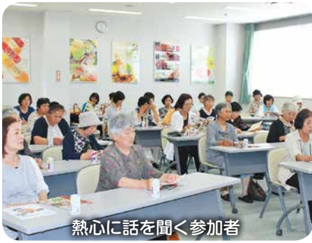
熱心に話を聞く参加者

六月八日、女性部グループ長研修を開催し三十九名が参加しました。視察先の宮崎県ジェイエイ食品開発研究所は、農畜産物の利用拡大を図り、農家経営の安定と向上を目的に設立されています。加工食品の研究開発や食品分析の施設を見学し、開発商品の説明を受けました。特許製法で絞った紫イモの果汁に日向夏とリンゴ果汁を合わせた、健康機能性ドリンクの試飲もありました。