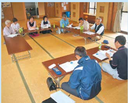
本村集落座談会の様子