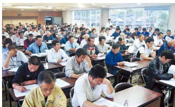
推進員大会の様子

5月9日、本所にて平成28年度農協推進員大会を開催しました。会では、農協と集落内の組合員との連絡係としての役割や業務について説明しました。続いて、第15回鹿児島県農民政治連盟あおぞら支部通常総会を開催しました。平成27年度活動報告など全5議案を承認し、参議院議員選挙と TPP 協定から農業・農村を守る運動の継続・強化に関する特別決議を採択しました。