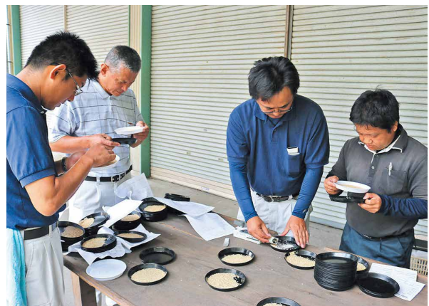
普通期米を確認する検査員

10月1日、普通期米の稲刈りが始まりました。台風の影響で、一部倒れたものもあり、品質の低下がみられました。10月12日にはヒノヒカリ152袋(玄米30kg/袋)を初検査しました。