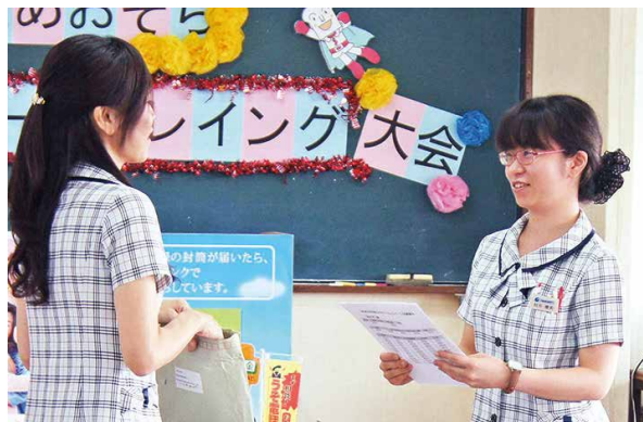
本所金融課チームのロールプレイング

JAは9月3日に本所で第2回窓口ロールプレイング大会を開催しました。本所、各支所・出向所の4チームが出場し、接客やあいさつなどの基本動作やコミュニケーション能力など10項目を審査しました。今後も、地域に親しまれるJAを目指し、窓口利用者へのよりよいサービスと、窓口対応技術の向上に努めます。