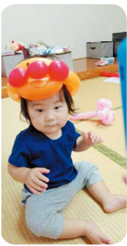
アンパンマン似合ってる?!