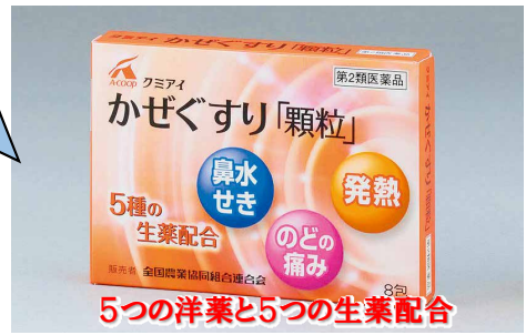
5つの洋薬と5つの生薬配合

クミアイ かぜカプセル「ゴールド」 第②類医薬品 12カプセル...900円(税抜き)