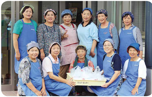
心を込めて作りました!!

九月十五日、女性部ではふれあい「愛の日」を実施しました。女性部グループのある地域の八十八歳以上の方とのふれあいを大切にしながら、敬老のお祝いの気持ちを込めて女性部の「愛」をお届けするものです。