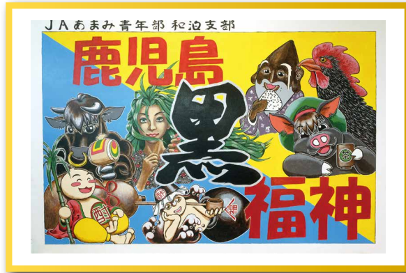
JAあまみ青年部 和泊支部