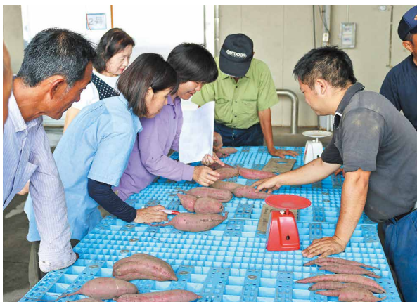
出荷規格を細かく確認

9月14日、西部貯蔵庫で加工用サツマイモの目ぞろえ会を開きました。統一の出荷規格を確認し、現物を手に取って選別基準を細かくチェックしました。平成28年産は昨年より日照量が多く、芋肥大も順調です。40戸が40畝で栽培し、1,200トンの出荷を見込んでいます。