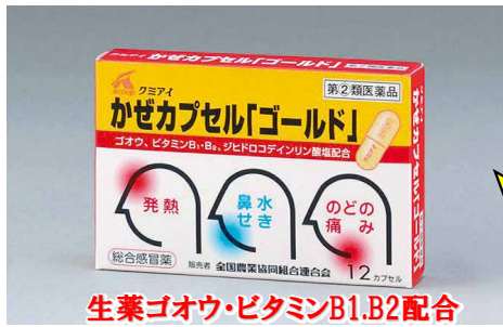
生薬ゴオウ・ビタミンB1,B2配合