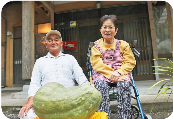
「もっと大きいのも穫れたんだよ」と大きなカボチャに大満足。初めて挑戦されたそうです。

平成17年から約4年間、群青で掲載していた「元気バリバリ」コーナーへ登場いただいた方に、およそ10年ぶりに再登場していただきます。以前と変わらぬ元気バリバリな様子を紹介します！