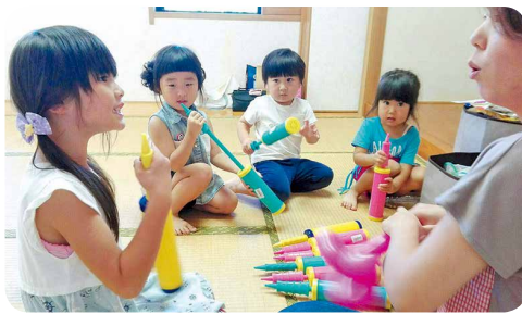
バルーンアート、みんなで作ろう!

九月九日、鹿児島市の都市農業センターで、JA鹿児島県女性協議会主催の、フレシユミズ鹿児島交流会がありました。ソフト巴厘や親子リトミック、ピザ作り、みそ玉作り、防災頭巾作り、バルーンアートなど内容盛りだくさんの一日でした!