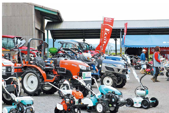
さまざまな農機具が展示されました

10月14日、燃料機械センターで秋の農機具展示会を開催しました。来場者はスタッフの説明を聞き、実際に触れて性能を確認していました。農作業安全啓発運動も行い、安全・快適な農作業を推進しました。なお、JA農機ハウスローンの案内もあわせて行いました。