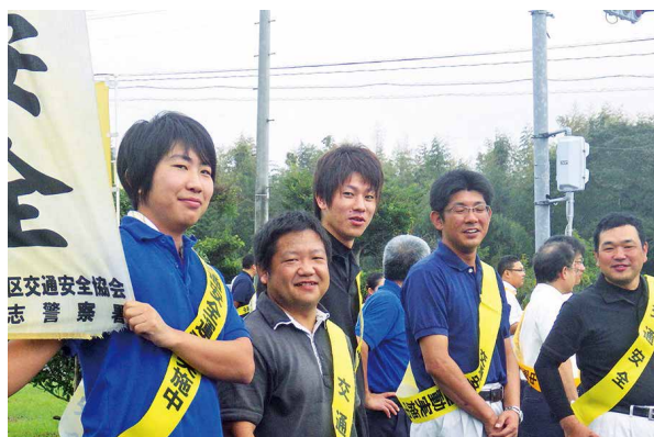
通山出向所前で交通安全を訴えました

秋の全国交通安全運動期間中の9月28日、志布志市内の国道220号線沿いと県道110号線沿いで交通安全推進のため1,000人街頭立哨パレードが行われました。交通事故撲滅に向けた交通安全に対する意識向上を図るため、また社会貢献・地域貢献活動の一環としてJA役職員も参加しました。