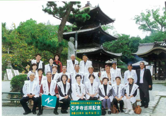
石手寺巡拝記念 日程2016年10月14日 四国八十八ヶ所霊場開創1202年

年金友の会 会員募集中です。 さまざまな特典、 各種イベントへの 招待などあります。 詳しくはお近くの 貯金窓口まで どうぞ。