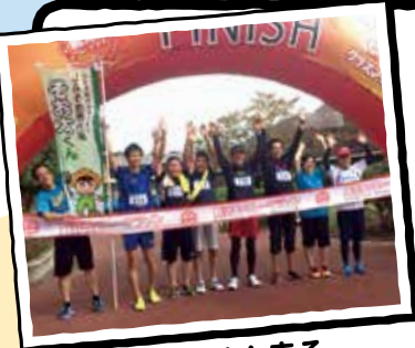
まれけん走る 走行会メンバー