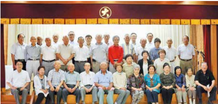
総会に出席した参加者

農林漁業団体退職者連盟あおぞら支部は、7月18日に志布志市で平成28年度総会を開催しました。 会では、会員拡大に努め、組織の活性化を図ることを目的に、連盟への加入を呼びかけることを確認しました。