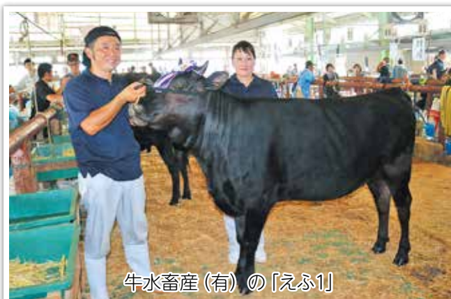
牛水畜産(有)の「えふ1」

5年後に開かれる第12回全共は霧島市牧園地区で開催されます。鹿児島県での開催は第2回大会（昭和45年開催）以来の2回目となります。