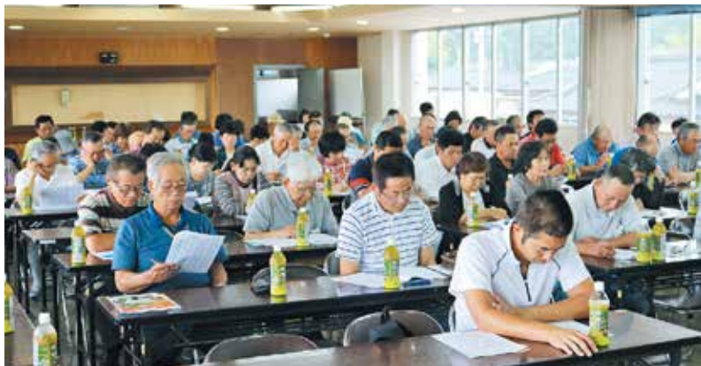
安心・安全な産地づくりの取り組みを確認した総会

会では、安心・安全な「おいしい農産物」生産に努めるとともに、行政と一体となった農業施策への取り組みを進めることを確認しました。