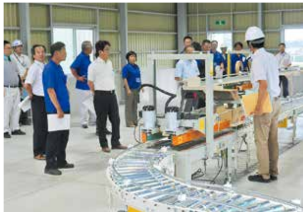
選果場を見学する関係者

選果場は、今年4月に完成した甘藷貯蔵庫の隣に建設しました。貯蔵庫に保管したサツマイモをリフトで選果場に運び込むことができます。集荷から貯蔵、選果、箱詰めを同じ敷地で行うことで効率化を図ります。 J Aでは、新たな貯蔵施設と選果場で品質・規格の統一を図り、計画出荷により、有利販売につとめ、生産者の所得向上を目指します。