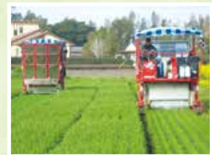
大麦若葉収穫の様子