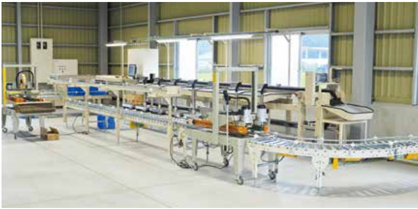
大きさ、重さ、形などを機械で選別します

J Aは7月27日、甘藷貯蔵施設選果場の完成検査を行いました。延べ床面積198平方メートル、目標選果量は1日10トです。これまで選別は、手作業で1日2ト程度の処理でしたが、機械化することで大幅に作業効率が上がります。