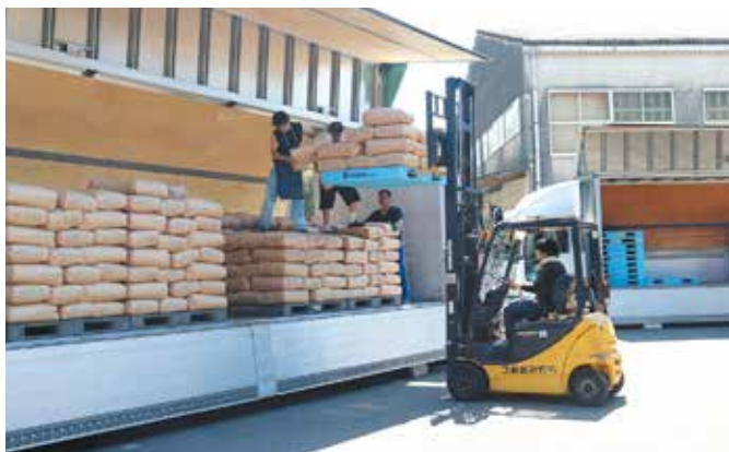
出荷される早期米