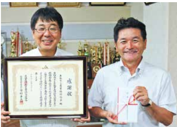
受賞を喜ぶ事故対応担当者

J Aは、平成28年度J A自動車共済損害調査サービスクラウド（新規契約5000件以下）で2年連続となる全国表彰を受けました。県内で唯一の受賞です。 選定は、J A自動車共済利用者満足度調査結果に基づき、J A全国共済連が行いました。 J Aの事故対応担当者は「お客さまの気持ちに寄り添い、交通事故の適正かつ迅速な対応をモットーにしています」と話しました。