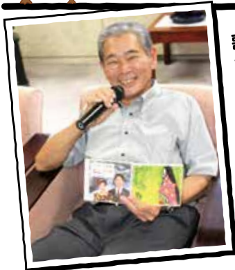
作詞してCDにした曲は3曲。歌うことも好きです!

法人・大規模農家だけでは、地域は守れない。小さな農家、兼業農家と共に相互扶助の精神で、一人は万人のために万人は一人のために、農協を支えることは、地域・集落を支える事でもある。共に明日に向かつて頑張りますよう。