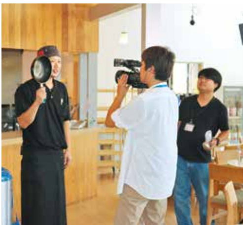
和やかに進みました

8月16日、あおぞら一丁目にて、KYT鹿児島読売テレビで毎週金曜日午後3時50分から放送されている「かごピタ」の収録がありました。 インドカレーと、緑茶と小豆のパンケーキ、グリーンティー苺レモンードを紹介し、あおぞら産品をPRしました。人気のカレーは、全5種用意し、本場の味を実際に食べてレポートしていただきました。 取材の内容は、8月25日に放送されました。