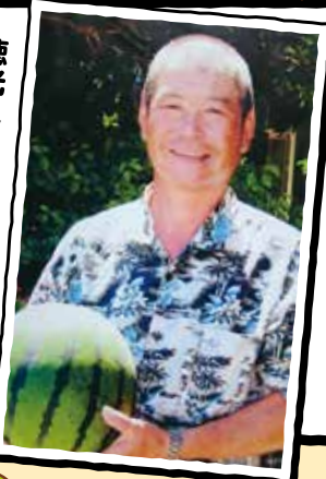
徳光スイカを育てるのが大好きです。

いかなる岩盤といえども私のドリルから逃れられない。競争をあまり協同組合を否定する動きが強まっています。みんな協同の大切さをこれまで以上に強く訴えてまいります。