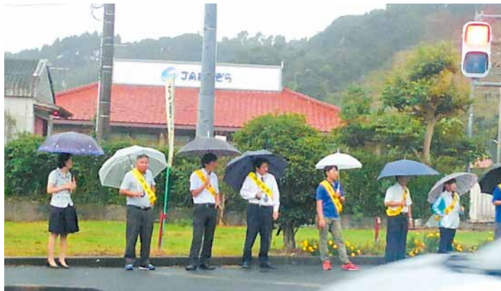
通山出向所前で呼びかけました

9月27日、志布志市内の国道220号線と県道110号線で、秋の全国交通安全運動期間に合わせて、交通安全を呼びかけるパレードが行われました。交通事故根絶のため、また交通安全思想の普及と浸透を図ることを目的に、多くの参加者がタスキをかけて沿道に立ちました。J A職員も、社会貢献・地域貢献活動の一環として参加し、通行する車両に交通安全を呼びかけました。