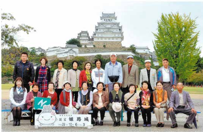
JAあおぞら年金友の会 世界文化遺産 国宝 姫路城

広島のと平和記念資料館や、船で渡るきのえ温泉、兵庫の姫路城や神戸中華街など散策を楽しみました。