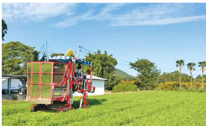
摘採が始まった大麦若葉

今年完成した甘藷選果場が、本格的に稼働を始めています。本年産は、害虫による茎葉の食害被害が一部ありましたが、天候に恵まれ順調な生育。39戸が33鈴で栽培しています。 9月上旬に目ざろえ会を開き、指導員が重量や直径、長さなど選別基準を細かく説明。生産者は規格の詳細を熱心に質問しました。新設した貯蔵庫に初めて集荷するため、コンテナの置き場所や荷卸し場所、受け入れ時の流れなども確認しました。