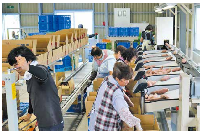
機械で、大きさ・重さ・形など選別します

今年完成した甘藷選果場が、本格的に稼働を始めています。本年産は、害虫による茎葉の食害被害が一部ありましたが、天候に恵まれ順調な生育。39戸が33鈴で栽培しています。 9月上旬に目ざろえ会を開き、指導員が重量や直径、長さなど選別基準を細かく説明。生産者は規格の詳細を熱心に質問しました。新設した貯蔵庫に初めて集荷するため、コンテナの置き場所や荷卸し場所、受け入れ時の流れなども確認しました。