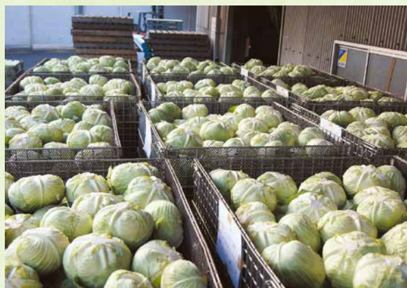
箱詰めの手間が省ける鉄コンテナでの出荷

J A では、加工用キャベツの苗をセル成形苗で供給しています。今年度は、栽培面積23.1畝ですので、9,200枚の苗を育て、8月26日から10月末まで配布しました。生育状況は、植え付け当初から台風等心配されましたが、順調に生育しています。