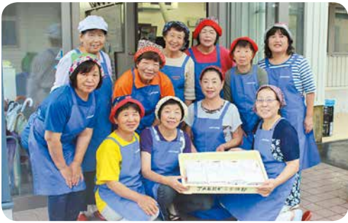
手作りしたちらし寿司やふくれ菓子を配達に出かける女性部員

9月15日、女性部は管内の88歳以上のご長寿の方々の自宅を訪問し、手作りのちらし寿司やふくれ菓子を手渡しました。JA事業を長年支えてくださっている組合員や地域住民の皆さまに感謝の気持ちを込めて「ふれあい愛の日」として、敬老の日に合わせて毎年行っています。お祝いの手紙を添えて、女性部員が約100食分を配りました。