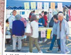
女性部、加工センター、Aコープによる、ふくれ菓子、ドレッシング、果物などの販売