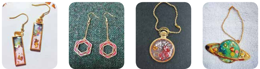
出来上がったアクセサリー