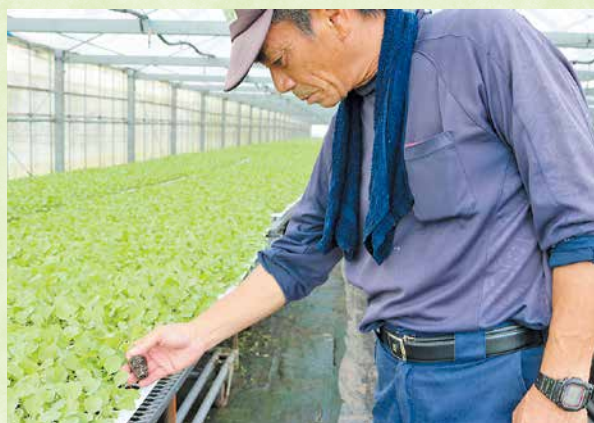
根がしっかり張っているか確認

加工野菜の需要は、今後も拡大傾向にあり、J A あおぞらも加工用キャベツの生産を充実させるとともに、求められる産地形成につとめたいと思います。