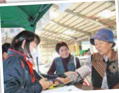
会場に設けた、福祉センターによる介護相談コーナー