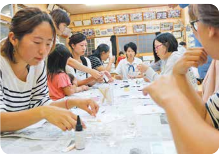
デザインどうしようかしら〜