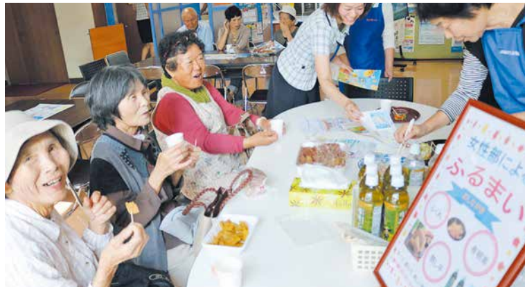
話に花が咲きました

また、職員らがキャンペーンのお知らせや広報誌などを配りながら積極的に声をかけ、来店者と話をしました。ふるまいは大盛況で、来店者からは「おいしかった。ありがとう」と感謝や喜びの声が聞かれました。J Aでは、今後も地域の皆さんが気軽に立ち寄れる店舗づくりを進めていきます。