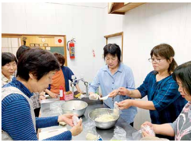
ホウ酸団子は独特のにおいが特徴ですが、それが効くそうです

5月13日から21日、管内7支部で座談会を開きました。サークル活動や人間ドック・ピンクリボン検診の案内、仲間づくり旅行など、今年度の活動内容を説明しました。学習会では、「家の光」にも掲載されたゴキブリホウ酸団子を作りました。ホウ酸とすりおろしたタマネギ、小麦粉、砂糖を、牛乳を加えながら練り合わせて、適当な大きさに丸めて、表面が乾くくらいに天日干ししたら完成です。簡単に作れるので、部員たちからも好評です。