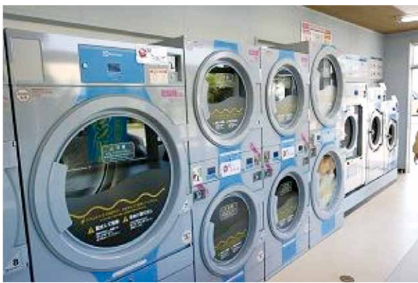
▲明るく清潔感のある空間となっています

適切な温度によるふわふわの仕上がりをぜひお試しください。営業時間は朝7時から夜7時までです。