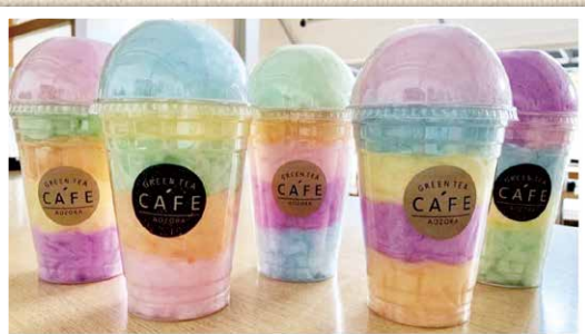
レインボーわたあめ 好評発売中!