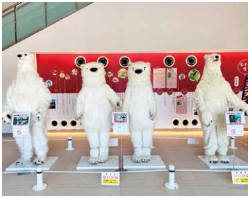
CMでおなじみのシロクマもお出迎えしてくれました

午後からは、平成29年に完成したセイカ食品日置工場で、アイスクリーム製造の様子を見学しました。