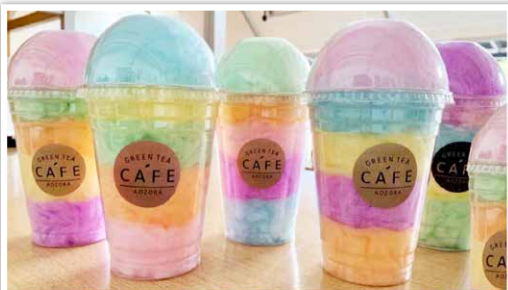
レインボーわたあめ 好評発売中!!

3か所の違いを探してください。 まちがいをみつけたら、左記の 写真に○印をつけてください。