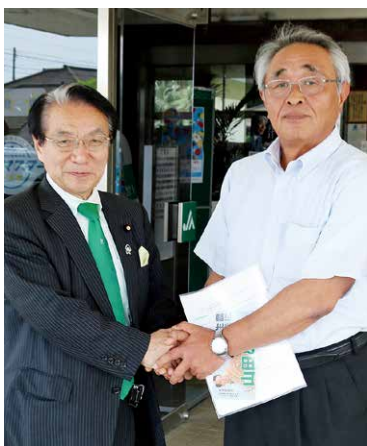
6月20日には山田としお参議院議員が県内J A巡回で来組され、農政を巡る情勢等について情勢報告をされました