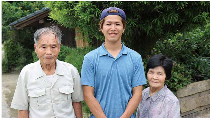
「まじめで仕事がはやいよ」とほめる平行さん㊦(玄弥さんが来て)「うれしいけどたいへん」とにっこりキエさん㊦