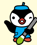
交通安全ポスターコンクール キャラクター 「ガシヨー」