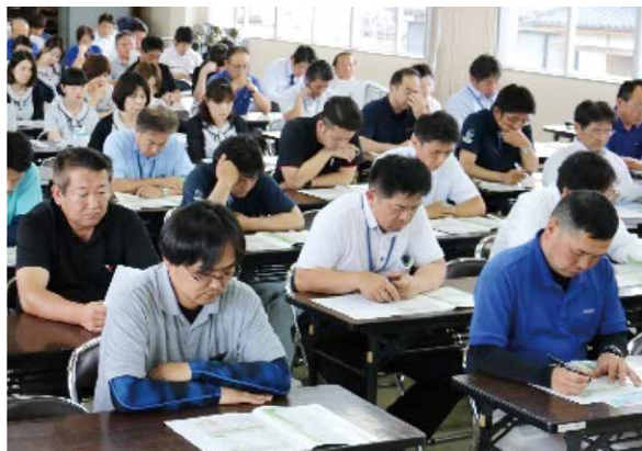
▲熱心に研修をうける職員ら

JAは6月12日、職員全体が情報を共有し意識を深めることを目的に研修会を開きました。