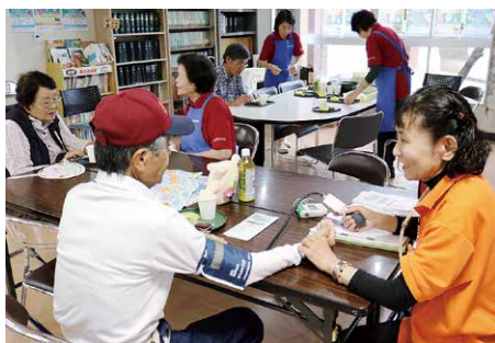
▲J A総合福祉センター職員が、血圧測定をして健康チェックも行いました