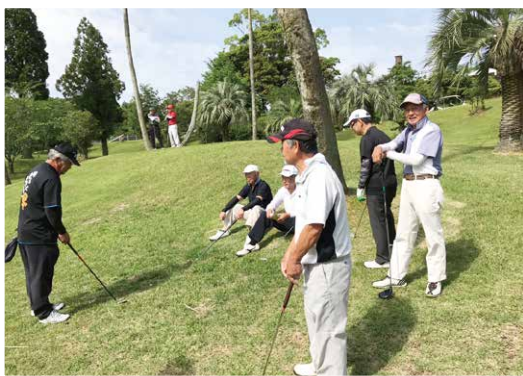
和気あいあい、楽しい時間を過ごされました