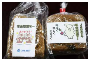
▲来店者へ贈ったふくれ菓子。「ありがとう」など感謝の言葉が入った手作りのシールを貼りました