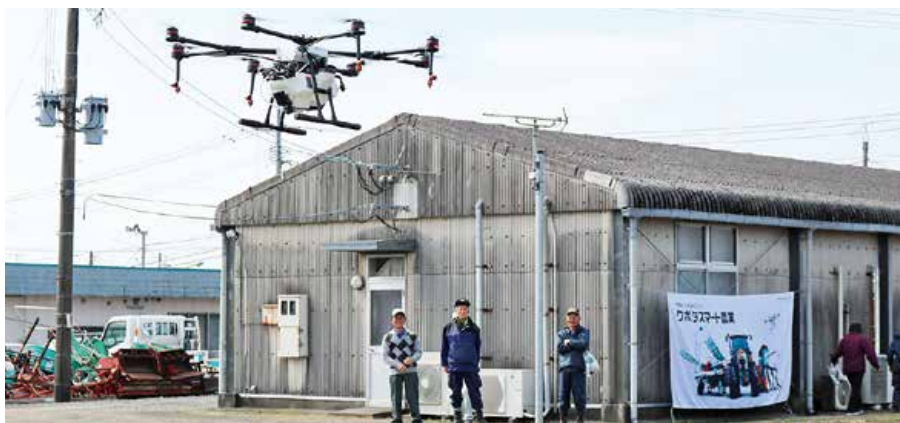
▲農薬散布などで活躍が期待されるドローン

大型トラクターを中心に、田植え 機、ミニ耕運機などの展示・紹介や、 実演・試乗が行われました。