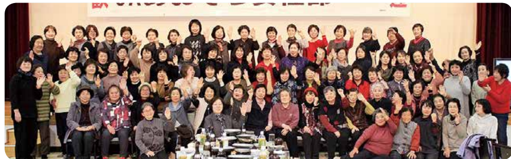
認知症サポーターキャラバン隊になった女性部員

午後からの交流会ではカラオケやダンス、お楽しみ抽選会などを行い、部員同士の交流を深め、楽しいひと時を過ごしました。