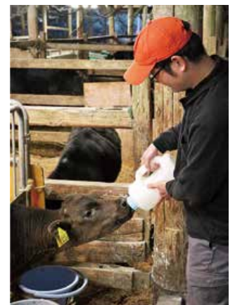
元気に育てと願いを込めて

もうすぐ就農してから1年になります。毎日新しい発見があり、楽しく仕事をしています。朝が早いのはちよつと大変ですけど、牛たちのことを考えると、全然つらくないですね。