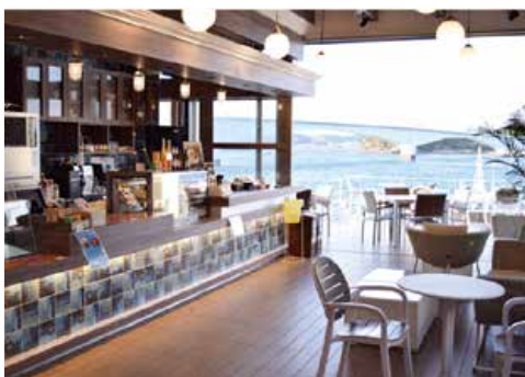
↓素敵なオーシャンビューでランチタイム