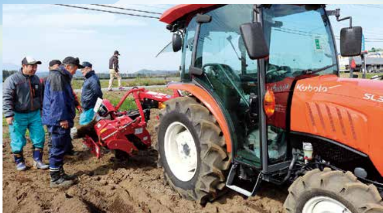
▲笑顔を変えながら説明を受ける組合員さん