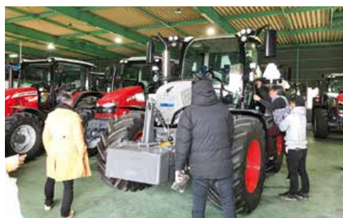
ちょっと乗ってみよう

1日目はサントリー熊本工場を視察し、商品の製造工程を見学しました。徹底した衛生管理や工程の効率化などに関する説明を受け、異なる業種から新たな刺激を受けることができました。その後、工場に併設された施設で完成したビールを試飲し、日頃の疲れを労うとともに、盟友同士の親交を深めました。