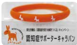
受講者全員に配られた「オレンジリング」

午後からの交流会ではカラオケやダンス、お楽しみ抽選会などを行い、部員同士の交流を深め、楽しいひと時を過ごしました。