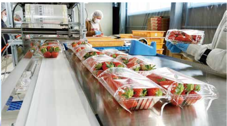
▲イチゴパックセンターでのパック詰め作業の様子