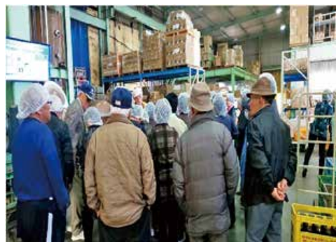
↑設備の説明を受ける参加者の皆さん