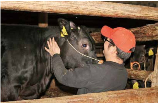
丁寧に牛の状態を確認めます