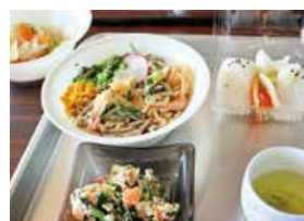
①愛情たっぷりの手作りそばセット

1月31日、女性部役員による「食と緑のバザー」をJA本所にて開催しました。「大切な食料と緑、農業を関係者が一丸となって守りましょう」と地産地消の取り組みとして、おにぎりや手打ちそば、白和えなどを愛情いっぱいに手作りました。