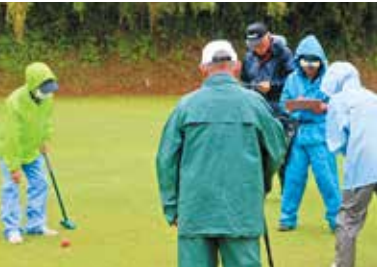
▲雨の中でもプレーは真剣