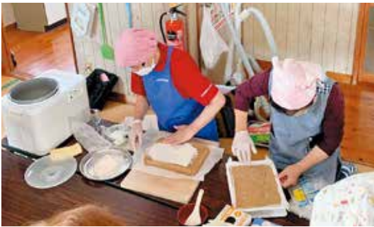
▲1つ1つ気持ちを込めて いこもち作り