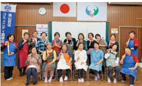
▲出来上がった「肩たたき棒」と一緒に1枚

肩たたき棒が大好評！ 女性部支部座談会 5月15日から19日にかけて、各校区の公民館で支部座談会を開催しました。合計71名の部員が参加し、座談会では健康体操や料理教室で、いこもち作りや肩たたき棒作りなどが行われました。いこもちが家庭でも簡単に作れると大人気でした。その他には、家の光4月号に掲載