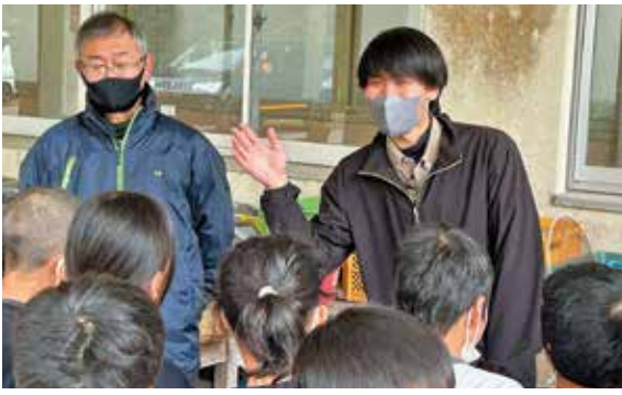
▲野神小学校でのお茶の手もみ体験