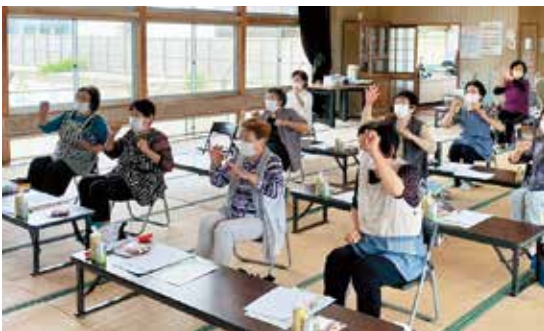
▲音楽に合わせて健康体操