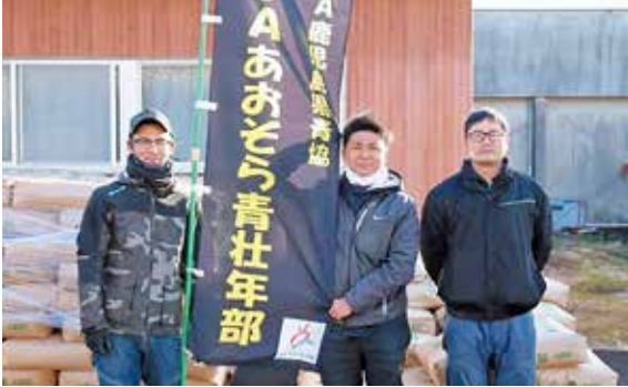
▲飼料特売での積み込み補助も行っています

JA あおぞら青壮年部は現在、24名の部員で活動しています。これから更に活躍していくため、一緒に活動する仲間を募っています。部員同士の交流はもちろん、小学校への出前授業や地域貢献活動にも力を入れています。頼もしい仲間と一緒に、色々な事に挑戦してみませんか？