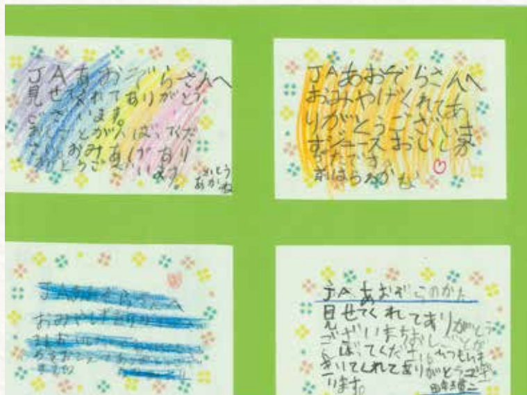
▲後日、お礼のお手紙まで書いてくれました。

JAあおぞらでは、食農教育にも力を入れています。管内小学校への特産品配布や、出前授業としてお茶の手もみ体験などを実施しています。