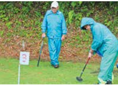
▲パットの力加減に苦戦中

転がりにくいグラウンドの状態に悪戦苦闘しましたが、「普段と違った楽しさがある」という声も聞かれました。