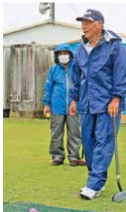
▲雨合羽姿もバッチリ決まっています