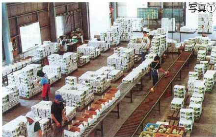
メロンの出荷作業に追われる選果場