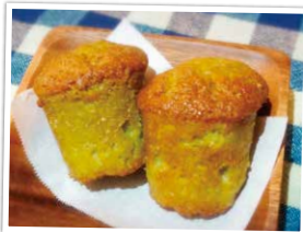
ヘルシー青汁マフィン