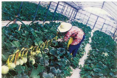
メロン玉吊り作業