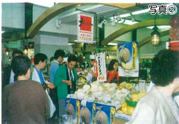
メロン販売促進 (大阪府阪急百貨店)