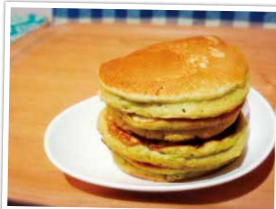
ほんのりグリーンホットケーキ